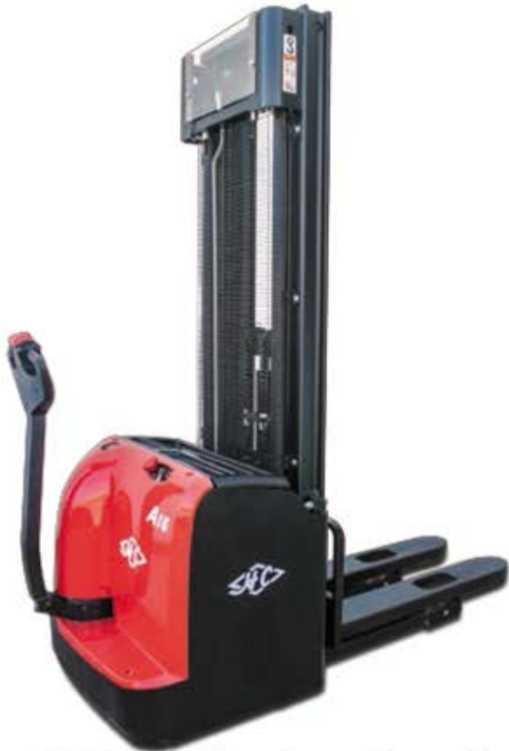
CDD_AC1 sin plataforma